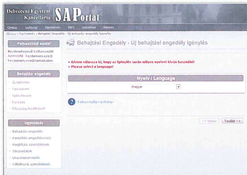
3. ábra Az igénylés nyelvének kiválasztása

A rendszer magyar és angol nyelvű igénylő felülettel rendelkezik. Az igényléskor kiválasztott nyelven történik a képernyőn az adatok megjelenítése valamint a felhasználónak küldött e-mail üzenetek nyelve.