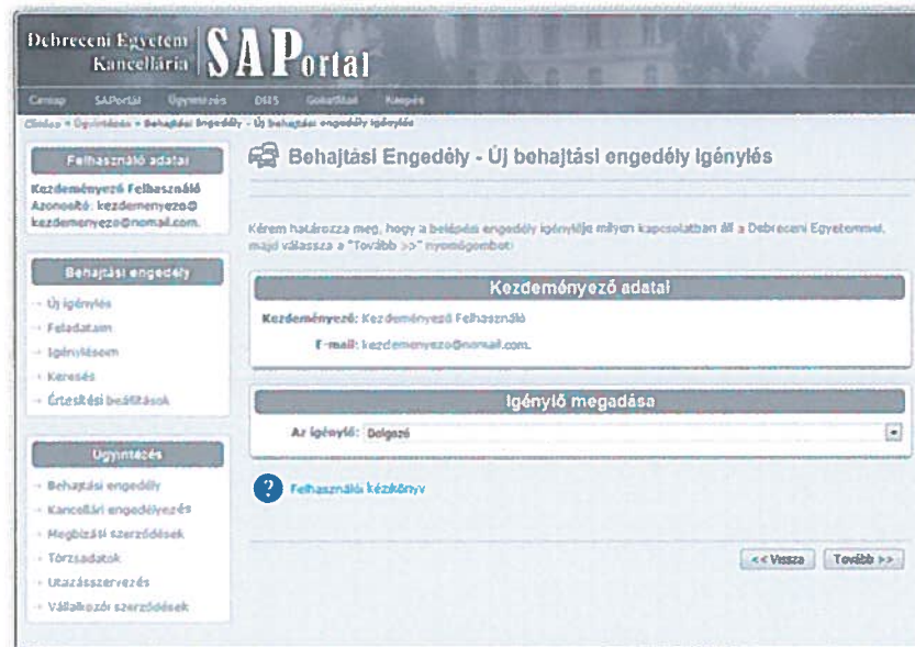
4. ábra Az igénylő típusának kiválasztása

Az igénylés nyelve után meg kell adni, hogy az igénylő milyen jogcímen kíván behajtási engedélyt igényelni a Debreceni Egyetemre.