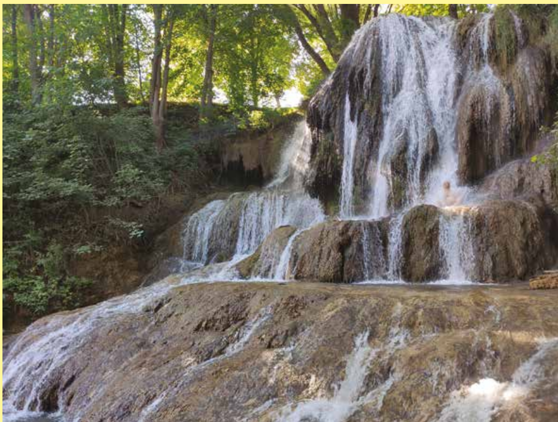
Lucski vízesés, Szlovákia

Az Egyetemi Élet folyamatosan várja verseiteket, prózáitokat a szepszelet@gmail.com -ra vagy a szerkesztőség címére!