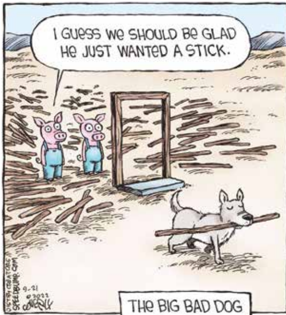
THE BIG BAD DOG